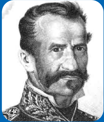
Gregorio Aráoz de Lamadrid